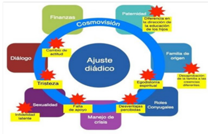
Figura 1. Cosmovisión ajuste diádico.